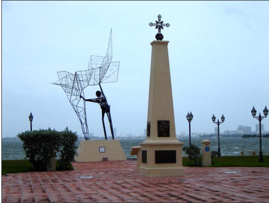
La Plaza de la Evangelización en la Casa de Retiros Juan Pablo II de la ACU en Miami