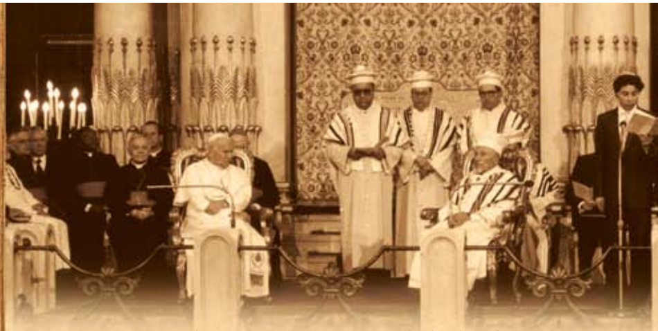
Pap Jan Pòl II nan Gran Sinagòg Wòm nan ansanm ak Rabay Elyo Toaf – 1986

YO, ANN IZRAYÈL. NOU PECHÈ KONT YO PASKE NOU TE PÈSEKITE YO PANDAN TOUT ANE SA YO. GWO PAWÒL SA YO ANTRE NAN ISTWA KI SOTI NAN GRAN LESPRI KAWÒL WOJTYLA, PAP YO TE RENMEN ANPIL LA PAP JAN PÒL II.